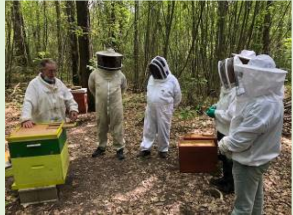
Essaimage artificiel avec plateau Barasc