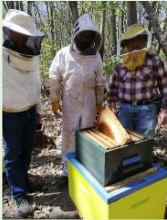
Essaimage sur ruche Warré

Malgré tous les aléas, au rucher nous avons fait le maximum, pour suivre le programme prévu, avec des décalages dans les dates.