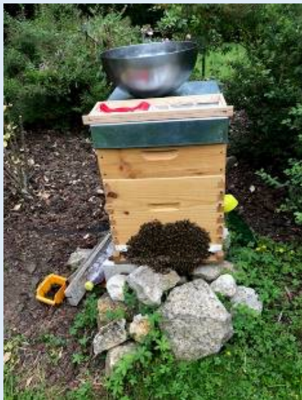
Les abeilles font la barbe