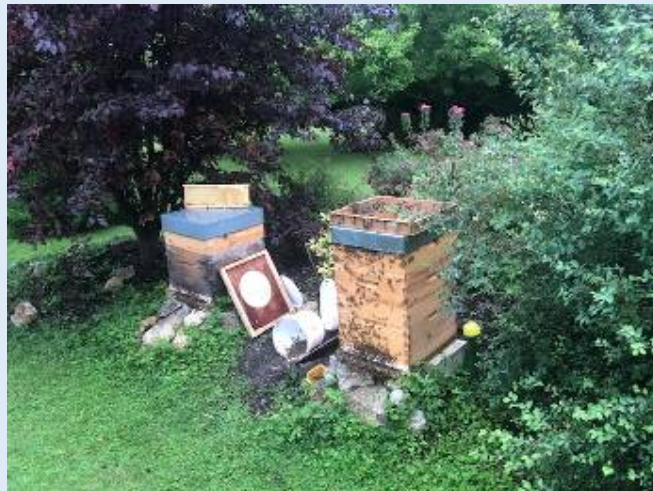
Un bel emplacement